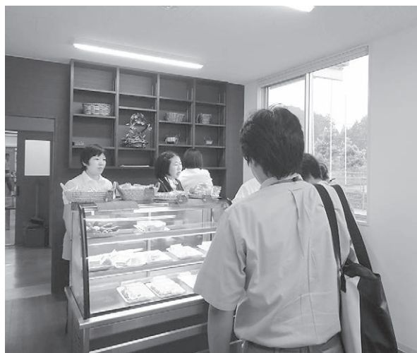
店舗ではトマトやかぼちゃ、茄子、赤ピーマン、キュウリのロールケーキやレアチーズケーキが好評です。

事業内容としては、香南市産の特産野菜を取り入れた洋菓子でスタートし、順次アレルギー対応菓子や機能性菓子の開発、販売、将来的には地域を巻き込んだ農産物生産活動まで展開することができればと考えております。野菜スイーツ店舗のオープンは6月24日とまだ日が浅いですが、スタッフ一丸となって取り組んでまいりますので、今後とも皆様方のご指導、ご支援よろしくごお願い申し上げます。