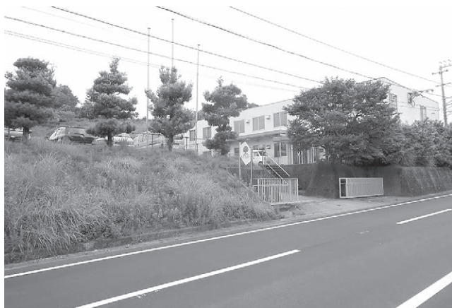
みかんの丘あけぼの施設外観（香南市香我美町下分684-1）

この調査実施におきましては、高知県精神保健福祉基金（高知県精神保健福祉協会基金事業）より助成をいただき、県外の先進的なA型事業所の効果的実践を視察できましたことを、大変感謝しております。この調査を基にA型事業所開所を計画し、2013年4月、香南市香我美町に「みかんの丘あけぼの」を開設することができました。